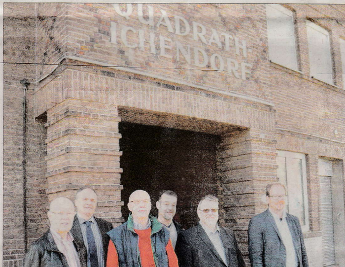
Mit Vertretern der Stadtverwaltung sahen sich Vereinsmitglieder das alte Bahnhofsgebäude in Quadrath-Ichendorf an.